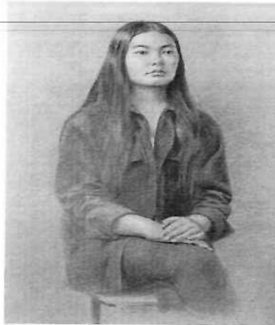
Сурет бойынша тапсырма үлгісі