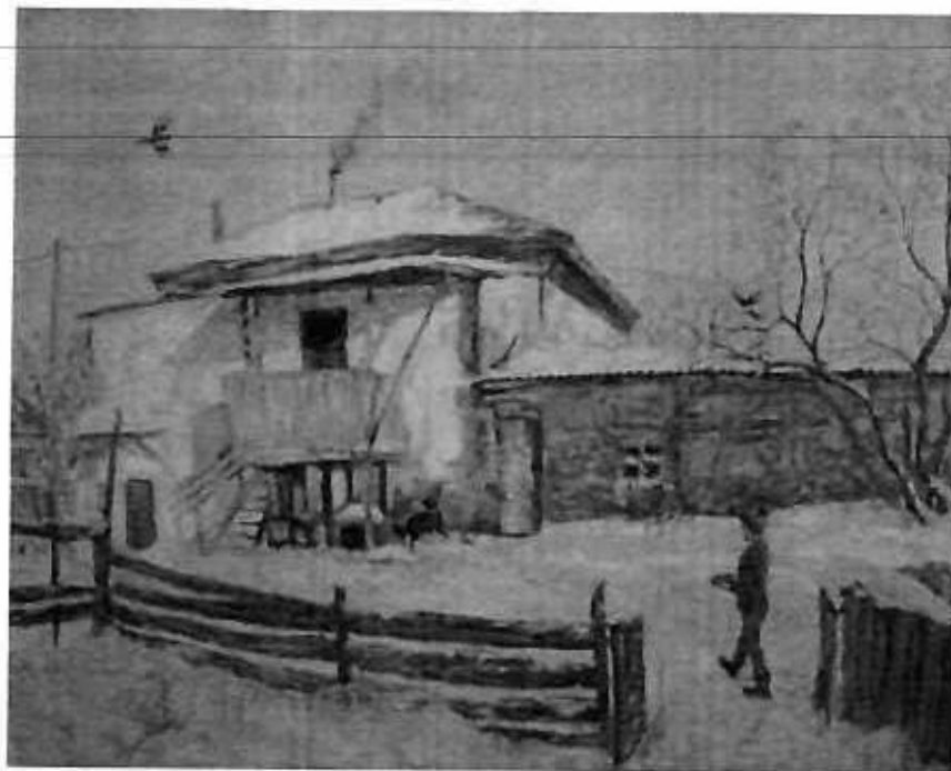
Композиция бойыниша татсырма үлгісі