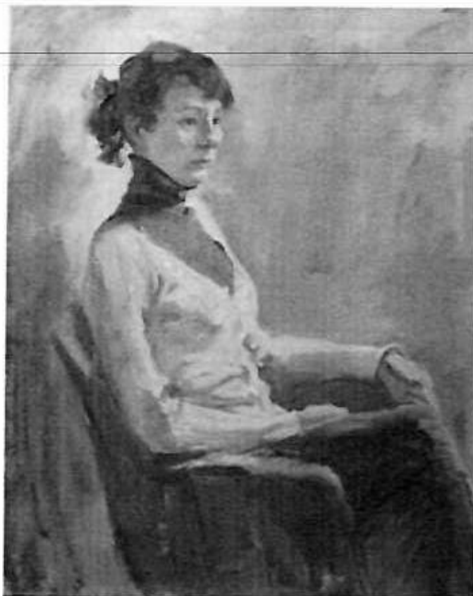
Кескіндеме бойынша тапсырма үлгісі

КОМПОЗИЦИЯ (П ШЫҒАРМАШЫЛЫҚ ЕМТИХАН) Жұмыс уақыты - 4 сағат